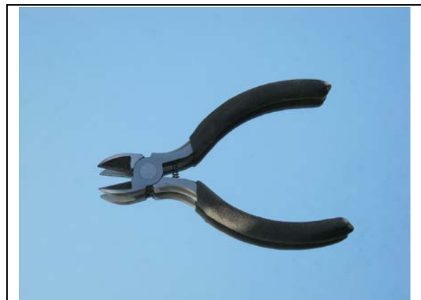
Abb. 2: Extraktion

Dokumentation dafür. „Wie wichtig solches Wissen ist, wird deutlich, wenn es für Änderungen oder eine neue Funktionalität der Software nicht zur Verfügung steht“, so Pichler. eKNOWS stellt das Fachwissen – das können mathematische Formeln, Entscheidungstabellen oder Datenflüsse sein – in verständlicher Form dar. Die interaktiven Darstellungsmöglichkeiten von eKNOWS ermöglichen ein besseres Verständnis, so können Programmpfade mit bestimmten Parameterwerten dargestellt werden. „Wir können die druckfertige Dokumentation, die interaktive Darstellung der Software oder auch wieder generierten Code in einer anderen Sprache mit dem Tool bereitstellen“, sagt Pichler.